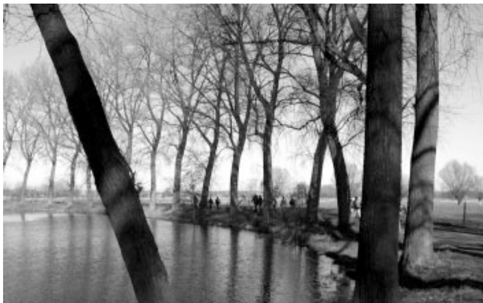
De Van Looyput langs de Blijpoelstraat.

De bodem van de Scheldevallei is rijk aan klei. Gedurende een paar honderd jaar en op sommige plaatsen tot het midden van vorige eeuw bestond in de streek een kleinschalige baksteenindustrie. De klei werd gewoon van het oppervlak afgegraven. Deze putten hebben zich later gevuld met water. De meanders van de vroegere Schelde zijn afgesneden bij de rechtekking eind 19de eeuw. Ze zijn rijk aan vis. Sommige werden visvijvers, andere beschermde natuurgebiedjes. Na 1960 werd de stroom nog uitgediept en verbreed.