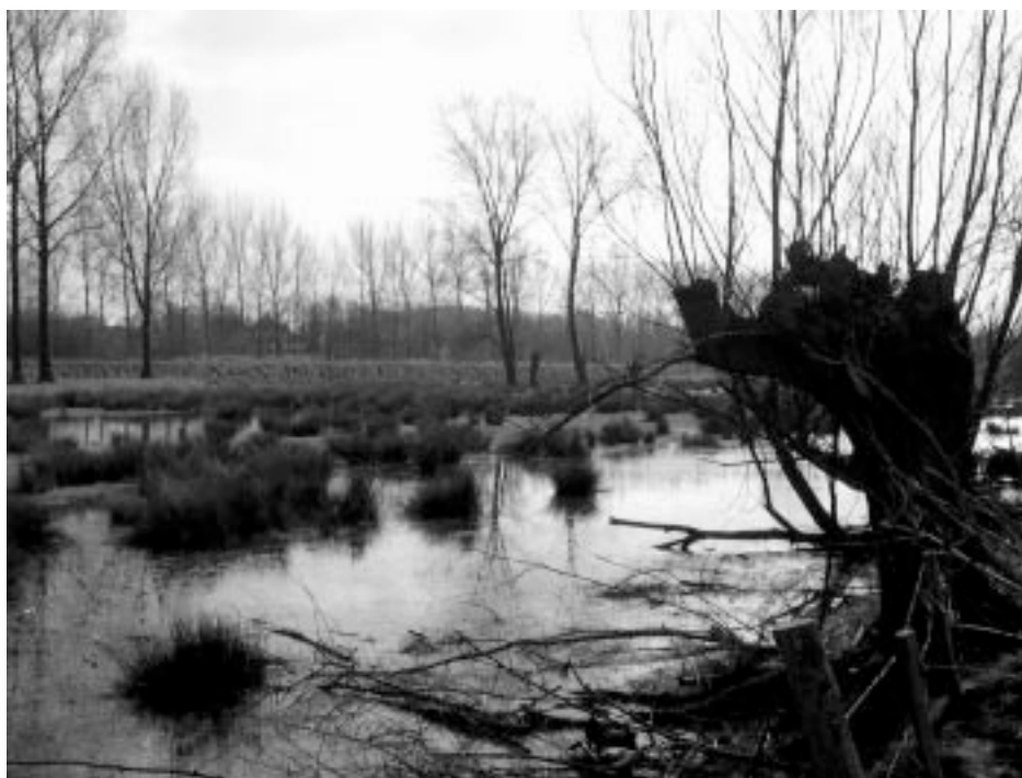
Moerasvegetatie in ondergelopen weiljes

Je neemt niet de landweg rechts maar gaat gewoon rechtdoor tot je na een tijdje aan de Scheldedijk komt via een trap.