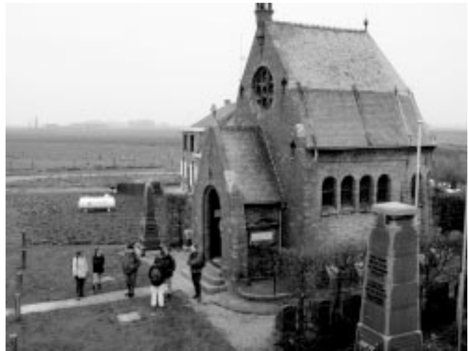
Onze-Lieve-Vrouwhoekje: beschermd oorlogslandschap.

Nu gaat het naar het de Viconiakleiputten. Neem daarvoor aan de kerk de weg rechts. Je komt voorbij de vakantiehoeve Viconia. Het natuurreservaat ligt er net over. Informeer je aan het infobord en trek het reservaat binnen tussen de waterplassen.