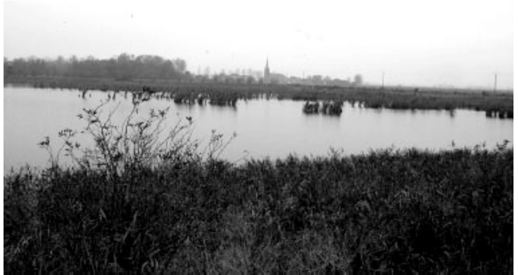
Staatsnatuurreservaat Viconiakleiputten, met de kerk van Stuivekenskerke op de achtergrond.

Goede observatie van de IJzerboord aan de overkant verraadt nog de plaats waar de Tervatebrug eertijds lag: je ziet er nog bakstenen boordversterking.