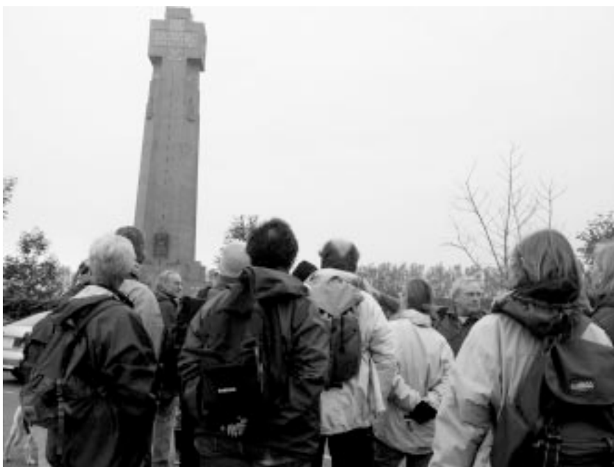
De toren en de site zijn geëvolueerd van symbool van hulde en eerherstel aan de Vlaamse gesneuvelden tot symbool van de Vlaamse ontvoogding.

Dwars de rijweg Diksmuide-Veurne en volg het pad verder. Links van je kun je de polders van Bachten de Kupe overschouwen.